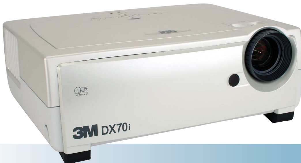
Proyector 3M™ DX70i 78-9236-7706-2

Con el proyector digital 3M DX70i, gracias a su tecnología DLP DarkChip3, proyectarás tu imagen a un nuevo nivel. Con el proyector digital 3M DX70i conseguirás imágenes excepcionalmente brillantes y nítidas, colores vibrantes y uniformidad de brillo.